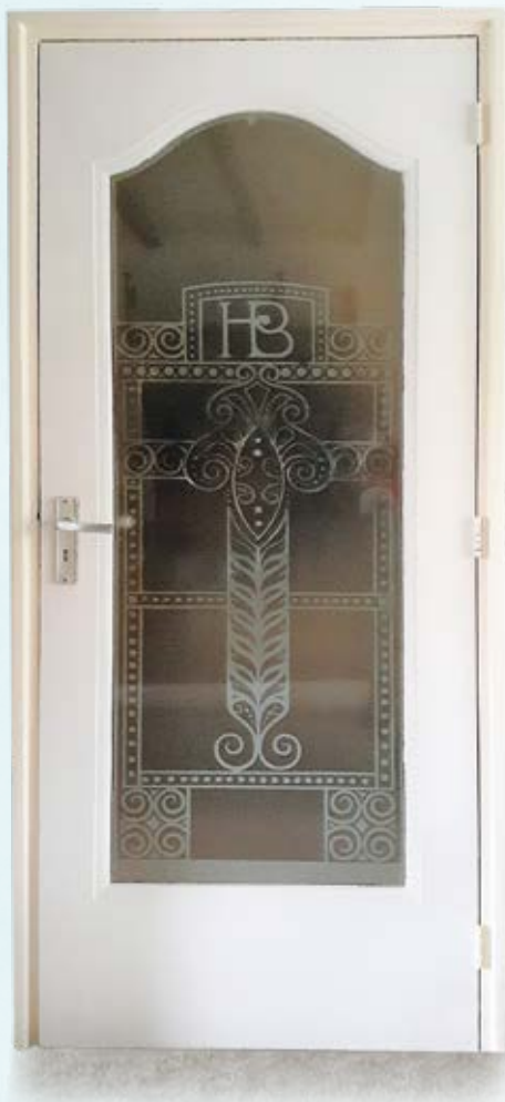
De glazen binnendeur van de Hanzebank.

“Historie valt met de deur in huis” klinkt misschien wat vreemd in de oren, maar zal in het navolgende duidelijk worden. Historie hoeft niet altijd ver gezocht te worden, soms is het dichtbij. Sterker nog, naar nu blijkt, in mijn jonge jaren bij mijn burens en sinds enkele jaren in mijn eigen huiskamer.