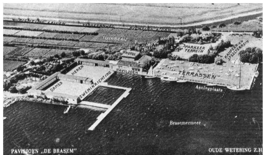
Een luchtfoto uit 1951 van het openwaterzwembad aan de Galgekade en omliggende percelen.

Maar ondertussen was het een heel gedrang op die duikplanken, want het duurde wel erg lang voordat iemand uitgekeken was en eindelijk eens van die plank af sprong.