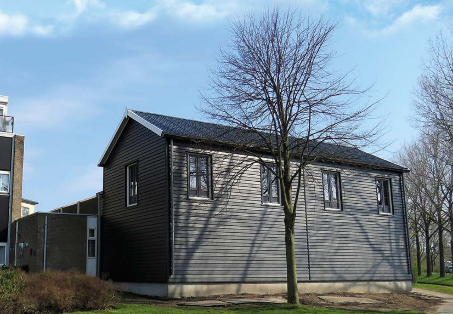
Het nieuwe depot