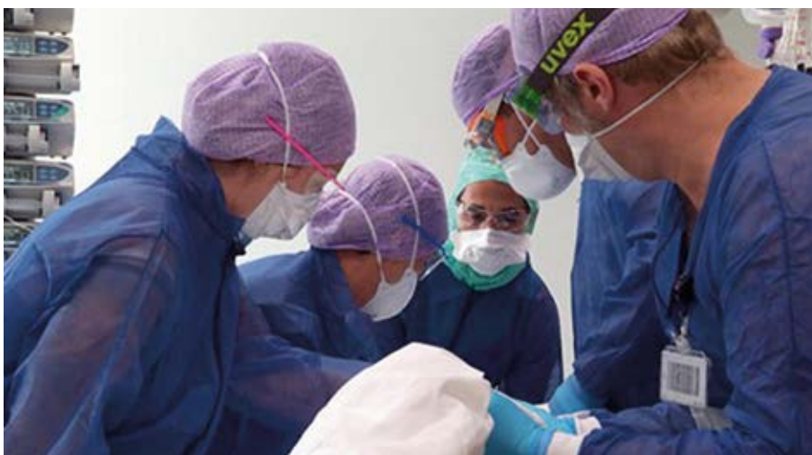
Behandeling van een corona patiënt.