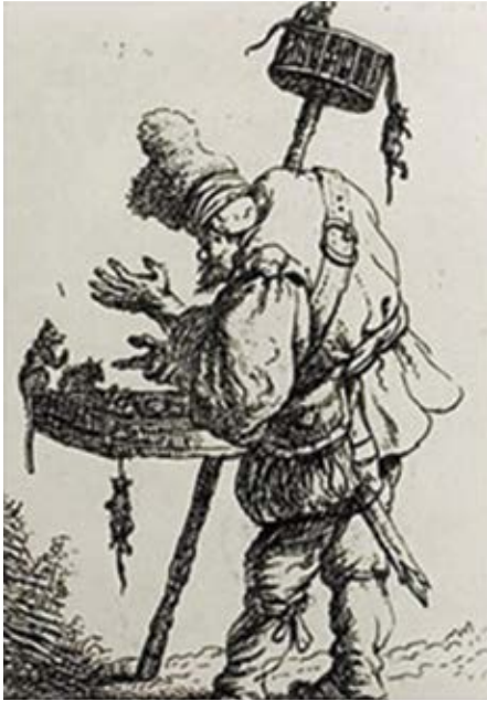
'De rattendoder' van Jan Georg van Vliet, ets uit 1632. Met name de zwarte rat verspreidde de pest via vlooiën naar de mens.

opnieuw getroffen: in 1624/25, 1635 en 1655. Er stierven respectievelijk 9.500, 14.000 en 10.000 Leidenaars op een bevolking van zo'n 50.000 zielen. De lijken verdwenen in massagraven, want begraven in de kerk was te gevaarlijk.