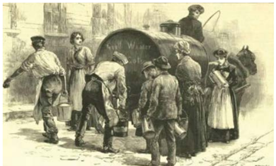
Een van de manieren om de cholera-epidemie te bestrijden. Het aanvoeren van schoon drinkwater.

Terwijl de overheid de verspreiding trachtte tegen te gaan door quarantaine-maatregelen, zochten geestelijken, medici en statistici naar de oorzaken. Dat een bacterie de oorzaak van de cholera was,