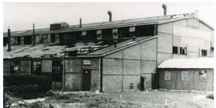
Links een ansichtkaart van de Muskator uit 1935, rechts na de explosie.