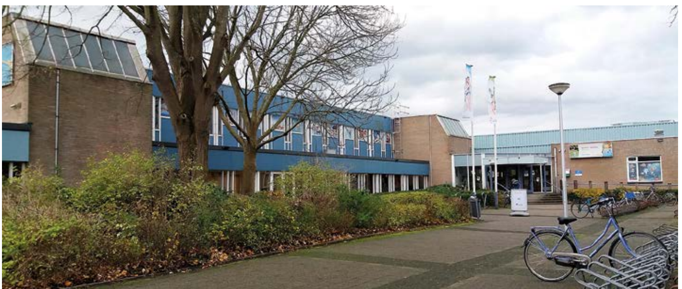
Het aanzicht van het huidige sportcomplex De Tweesprong.

zwemclub als de gemeente. De huur van het bad gaat van f 38,50 naar f 100,- resp. f 200,- per uur. De zwemclub kan dit echter niet opbrengen, dus moet de gemeente bijspringen met een jaarlijkse subsidie. In 2011 wordt in de gemeenteraad, in het kader van de bezuinigingen, een voorstel besproken om het zwembad te sluiten. Gelukkig voor de hele gemeenschap werd dit voorstel niet aangenomen.