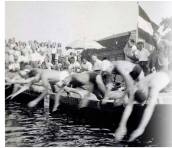
Impressies van de zwemwedstrijd in Oude Wetering.

Naast wedstrijden in het zwembad werden er, onder zeer grote belangstelling, ook jaarlijks wedstrijden in het water langs de Veerstraat in Oude Wetering georganiseerd. Vanaf het pont tot palingrokerij Kraan heen en terug was 1 kilometer. De prijsuitreiking was in het paviljoen van Ad Zegers.