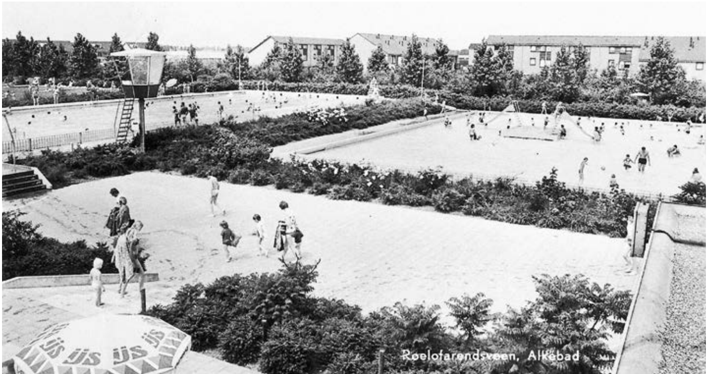
Een overzicht van het in 1971 aangelegde Alkebad.

meente aan de Koninklijke Nederlandse Heide Maatschappij een opdracht om een plan te maken voor een nieuw openluchtzwembad dat niet in buitenwater is gelegen. De Heide Mij ontwerpt, samen met de gemeente, een nieuwe zwemaccommodatie met een 50-meterbad, een speelbad voor kleine kinderen, een grote speelweide en een overdekt instructiebad van 16 meter. In 1970 wordt het 'Alkebad' geopend. Op 1 januari 1971 wordt Zwem- en Poloclub Alkemade opgericht.