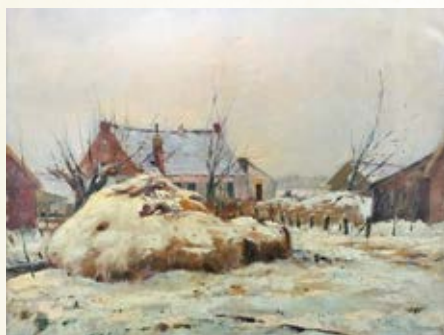
Schilderij van Marinus Heijnes (Amsterdam 1888 - Kaag 1963): 'Uitzicht vanuit het atelier'. Het atelier was gelegen aan de Julianalaan 44 op de Kaag.