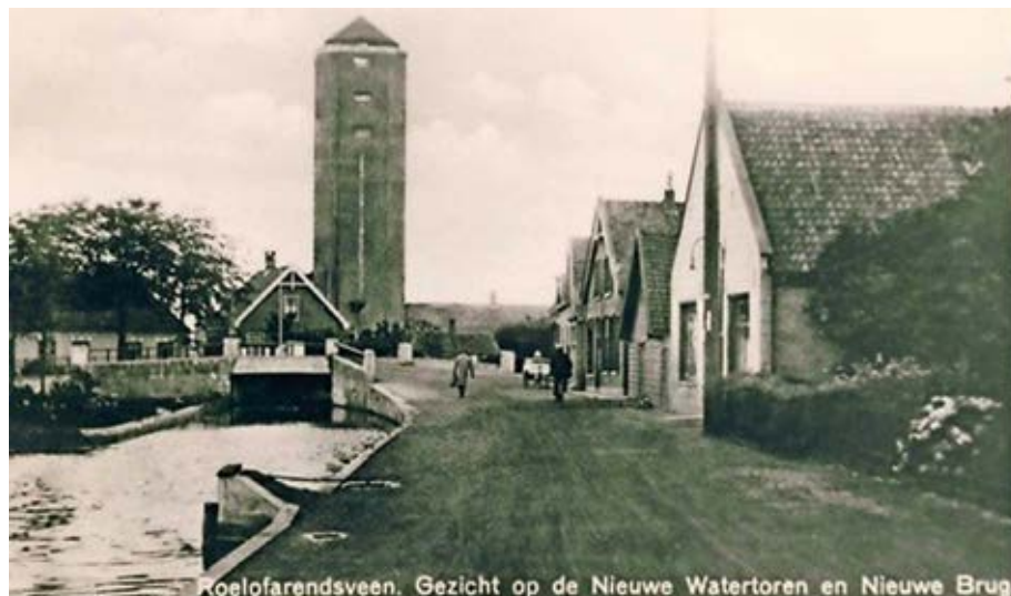
Een Ansichtkaart uit de beginjaren 1930. De 'nieuwe' brug werd in 1940 gesloopt.

Tijdens pestepidemieën in Leiden hing men een strohoed aan het besmette huis. Huisgenoten mochten alleen met een witte stok in de hand op pad en mochten niet naar kerk of school. Alleen