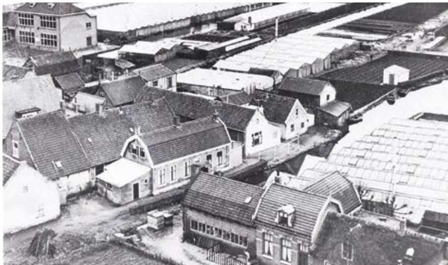
Foto van de 'Kakelwurt' aan het Noordeinde in Roelofarendsveen met links de nieuwe hoogbouw van de St. Ignatius school. De dichte behuizing maakt duidelijk dat hier heel veel mensen op elkaar woonden.

Opvallend genoeg hield het gemeentebestuur zich niet met de ziekte bezig. In de