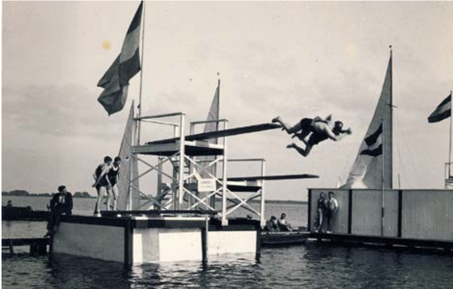
Een springschans met twee duikplanken op verschillende hoogte neemt in 1949 de plaats in van de glijbaan.

In de loop van de jaren werd het paviljoen door Ad Zegers uitgebreid met een café-restaurant met bar en hotelvoorziening. Op 20 juli 1953 behandelt de gemeenteraad het voorstel om een gedeelte van de zwemaccommodatie te verkopen aan Zegers. Het gaat om 68 are. De raadsleden voelen er niet veel voor. De exploitatie van het paviljoen, al eigendom van Zegers, gaat helemaal niet naar hun zin. Een ingezetene had geconstateerd dat een man met ontbloot bovenlijf zich meer dan ergerlijk in het paviljoen had aangesteld. Men vroeg zich af wat dat moest worden als Zegers eigenaar zou zijn van een nog groter stuk. Uiteindelijk wordt alles uitgepraat met Zegers, waar-