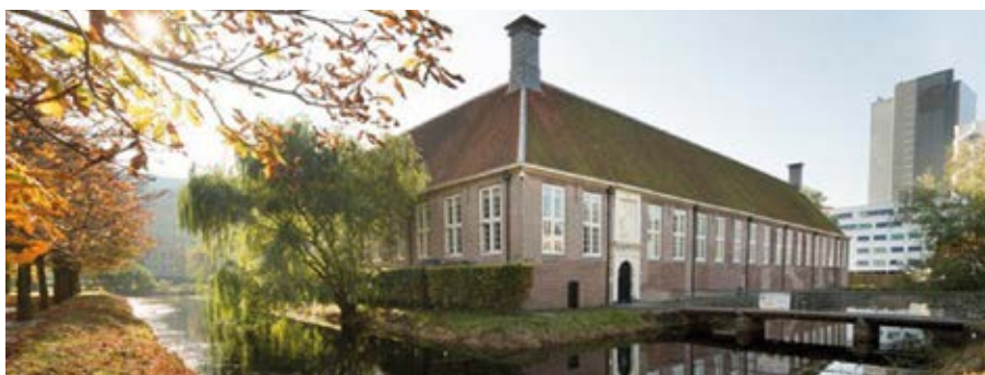
Het Pesthuis uit 1661 in Leiden, gelegen net buiten de historische binnenstad aan de Pesthuislaan 7.